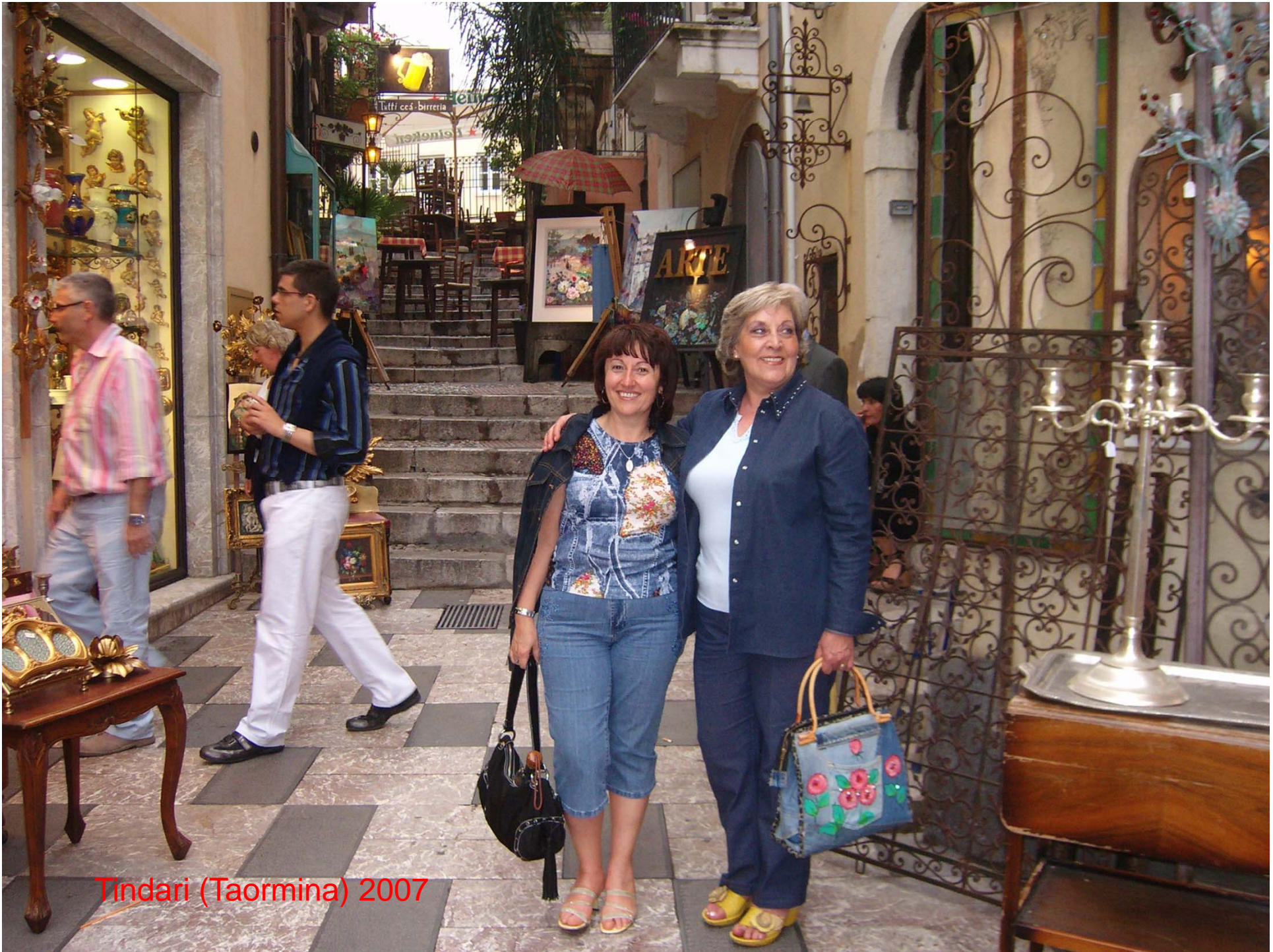
Tindari (Taormina) 2007