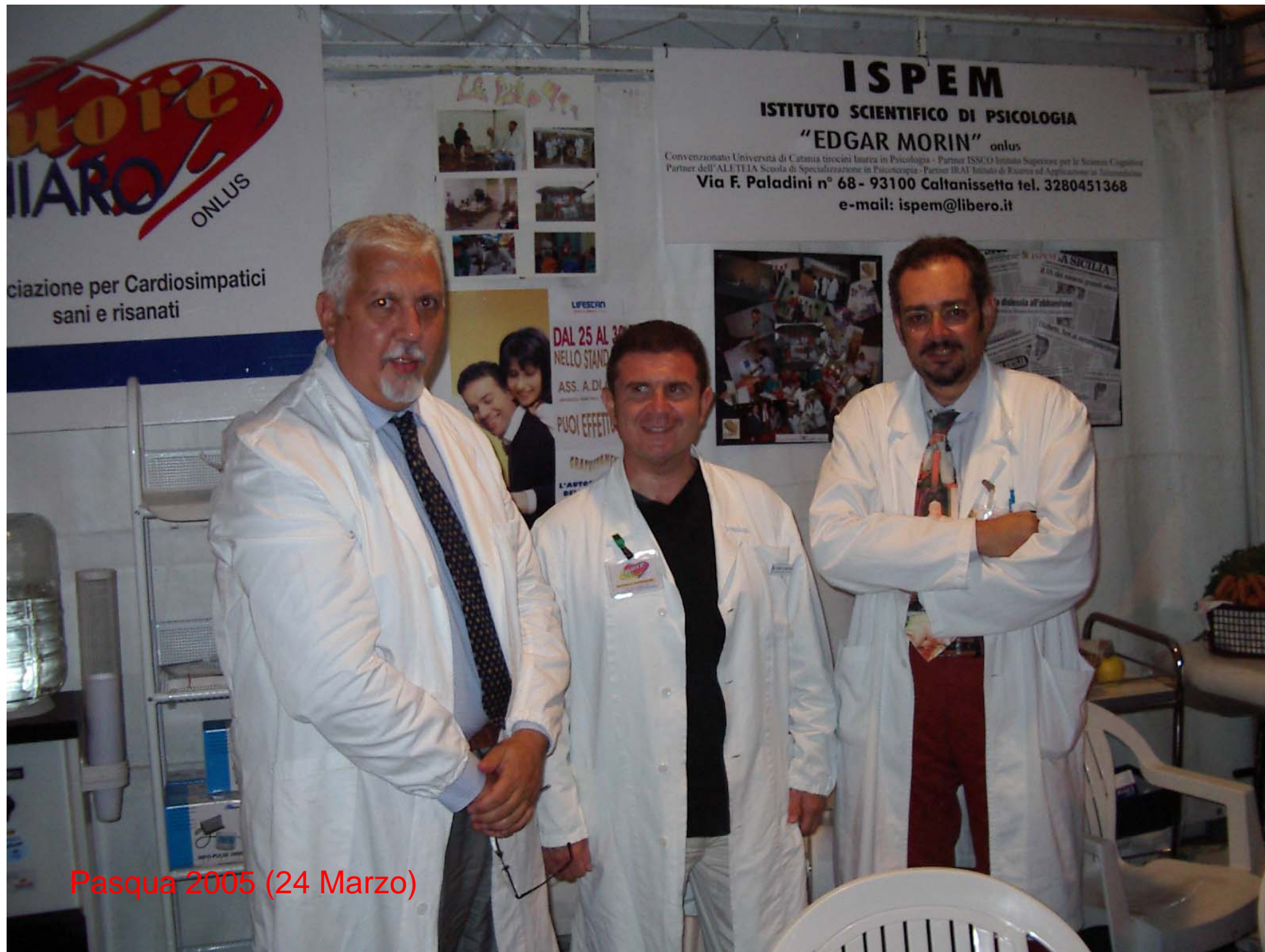
Pasqua 2005 (24 Marzo)