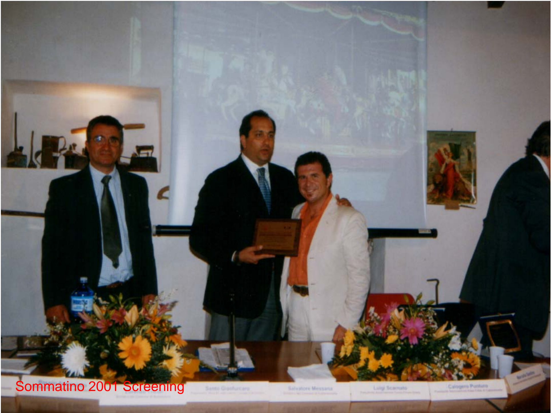
Sommatino 2001 Screening