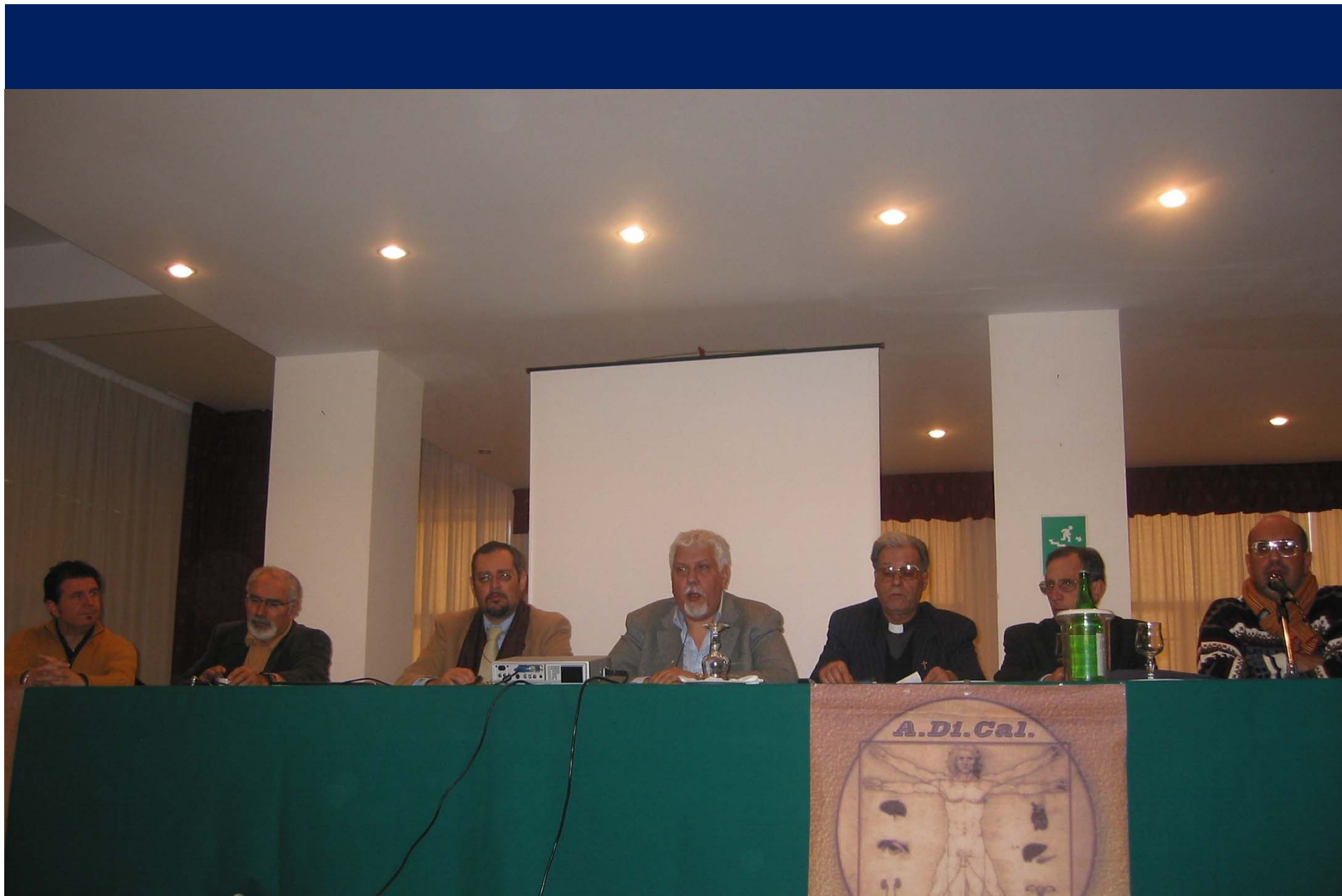
Camposcuola, Trecastagni (Ct), 2005